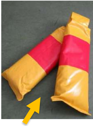
止水板用おもり 【防水仕様】