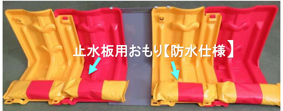
止水板用おもり【防水仕様】