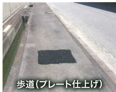
歩道(プレート仕上げ)