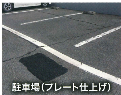
駐車場(プレート仕上げ)