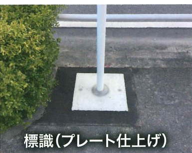
標識(プレート仕上げ)