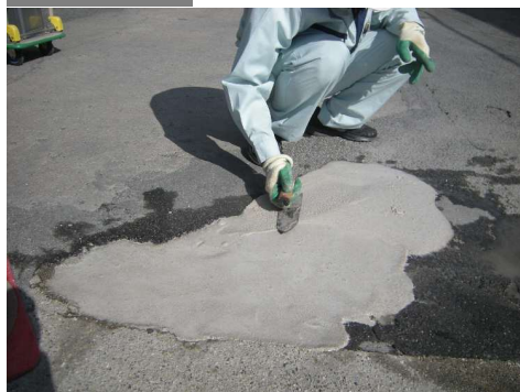
コンクリート舗装補修