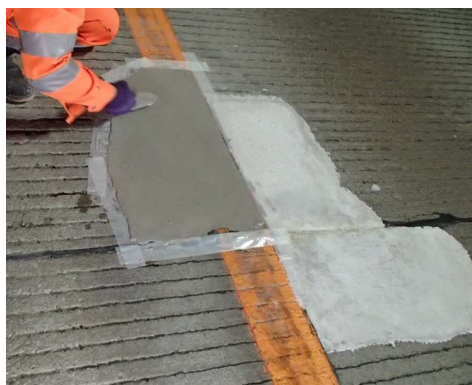
ポットホール補修